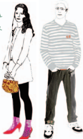
journées à deux