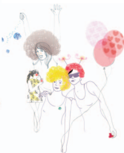
les enterrements de vie de jeune fille