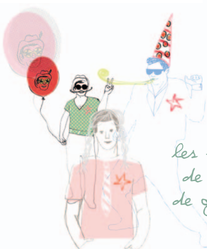
les enterrements de vie de garçon